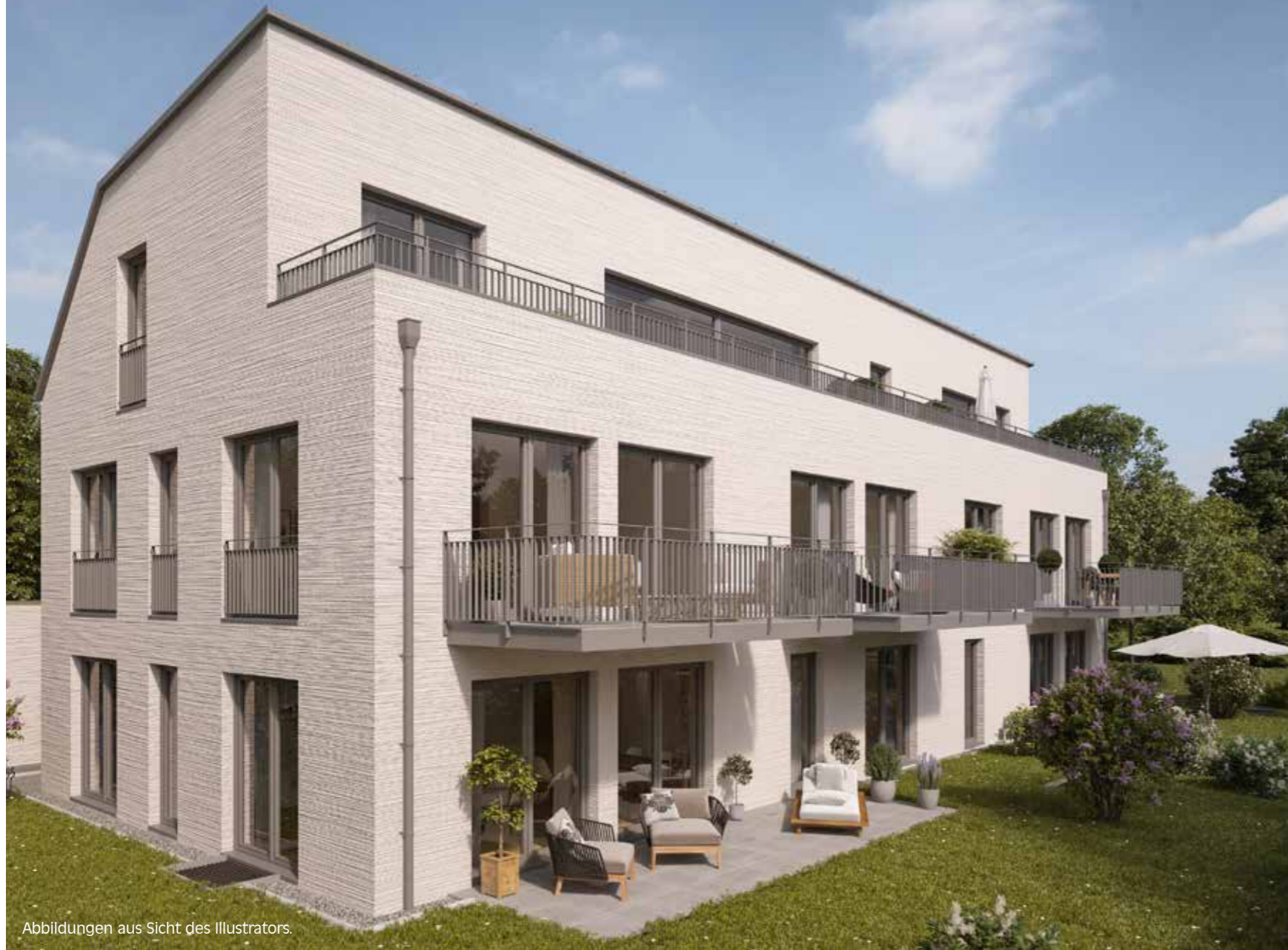
Abbildungen aus Sicht des Illustrators.