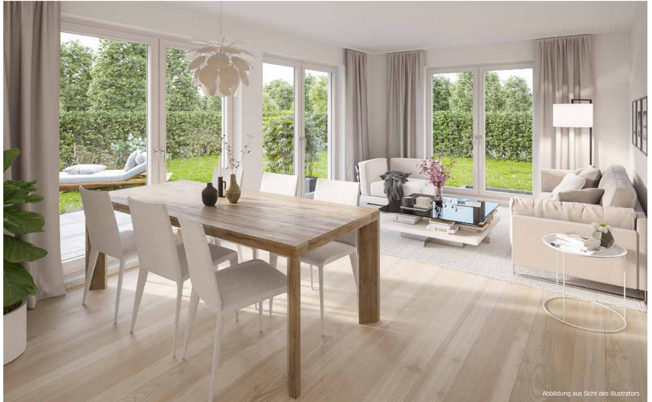
Abbildung aus Sicht des Illustrators.